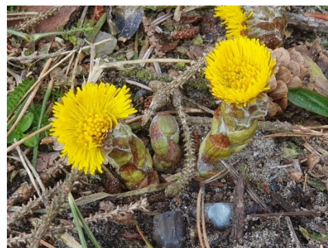
Figur 5 Det varer ikke så længe før følfoden stikker op igennem overfladen og breder sin blomst ud.