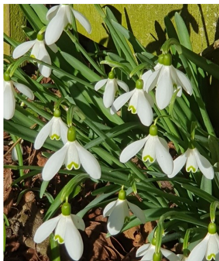
Figur 4 En kær gæst, når det er vinter og foråret banker på.