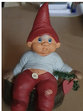
Figur 2 Nissen, Morten