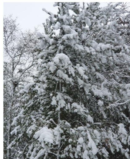
Figur 1 Snetunge grangrene.

Når I nu kommer op til jeres huse, så læg lige mærke til hvordan træerne fylder mere, når der er sne på dem. Store, lange grene, der måske ikke spærrer til daglig, er pludselig et problem. Det sker, når der er sne på grenene, der tynger dem ned. Eller når træerne mangler vand som i sommers. Så er det pludselig meget tydeligt, at her skal saves en gren eller to for, at alle kan komme frem.