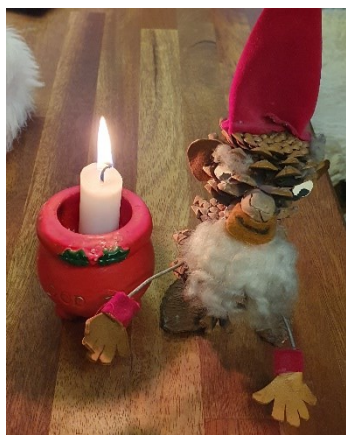
Figur 3 En meget gammel nisse og et levende lys.

Sommerhuset er for os rammen eller stedet, hvor vi tager hen, når vi trænger til noget natur, en brændeovn, der knitrer eller bare har brug for en pause fra den normale hverdag.