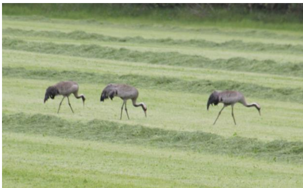
Figur 1 Traner vest for Moseby på nyslået græs