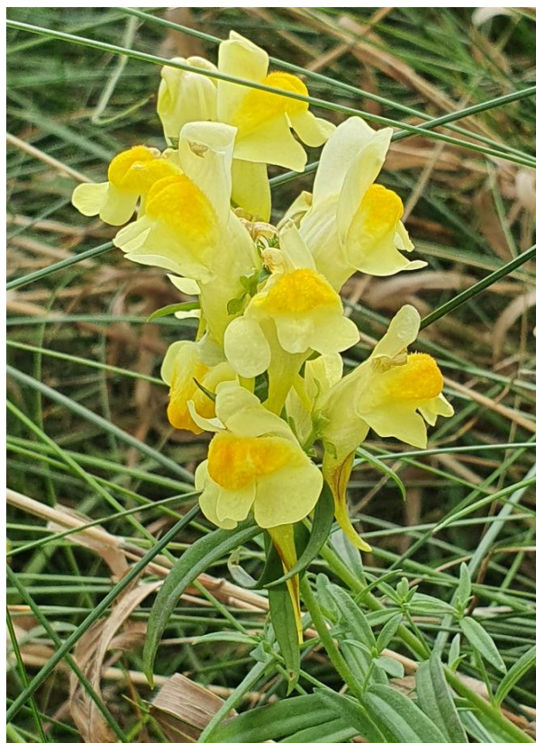
Figur 6 Løvetand på dådyrvej