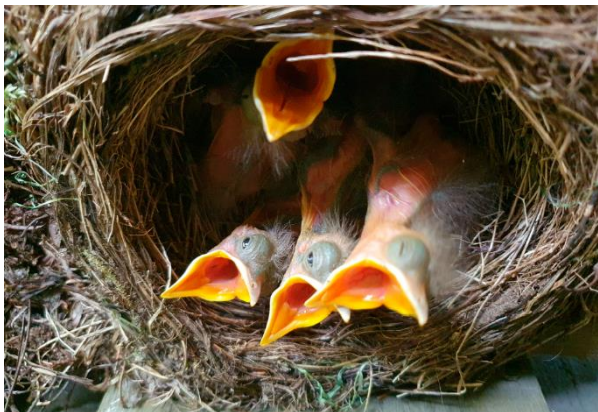
Figur 2 Solsorteungersom vist altid er sultne