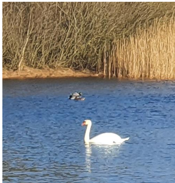
Figur 5 Svane og ænder på Bratbjergsøerne

Amdi, Egernvej 5, tilføjer, at vi måske næste år, skal hæve kontingentet på baggrund af stigende priser og de voldsomt stigende brændstofpriser.