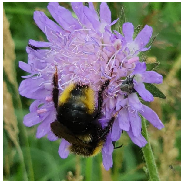
Figur 4 Der arbejdes med pollen og måske honning

Amdi, Egernvej 5, – siger, at vi før har besluttet at hvis vi løser et fælles problem så det ok, men hvis, det er den enkelte grundejers problem, er det dem der skal betale.