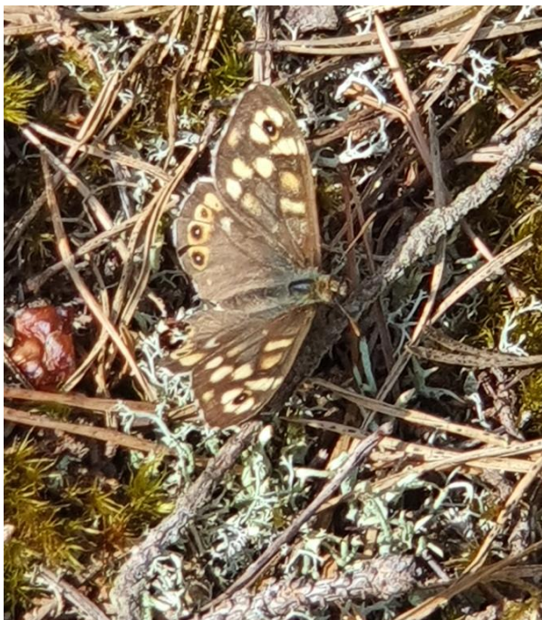
Figur 3 En sommerfugl på min vej